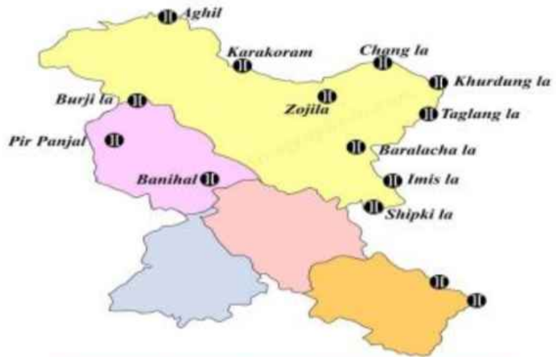
Major Passes in India