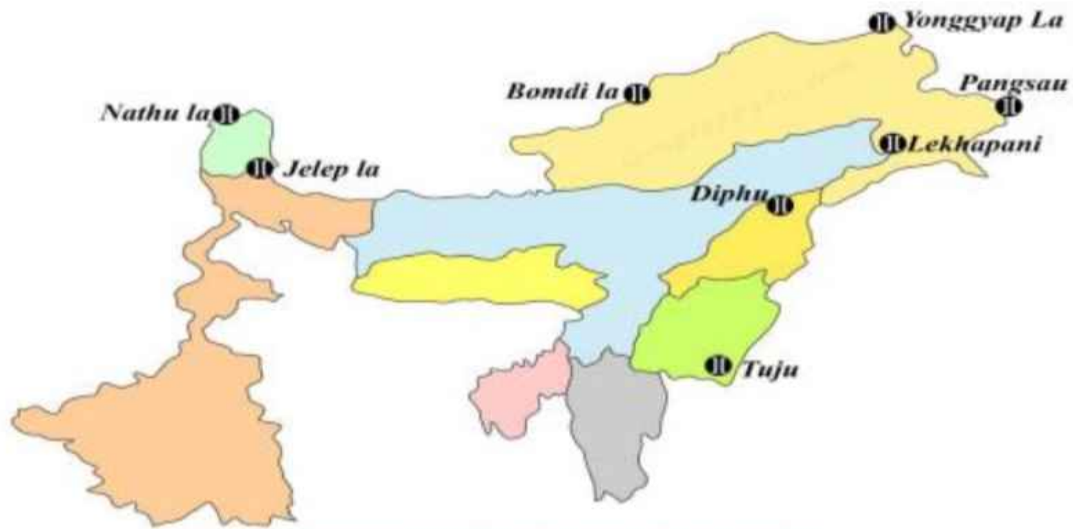
Major Passes in India